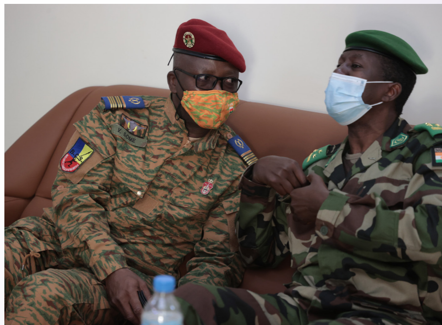
Le CEMA du Niger et le CEMGA adjoint du Burkina Faso