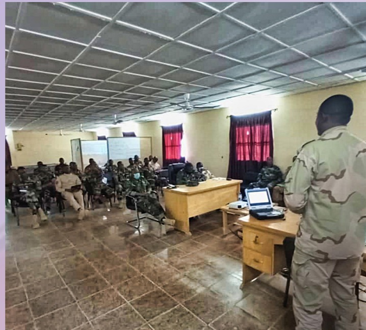
Briefing opérationnel au PCC de Tillabéri

TAANLI signifie «Alliance», «cohésion» en langue gulmatchéma.