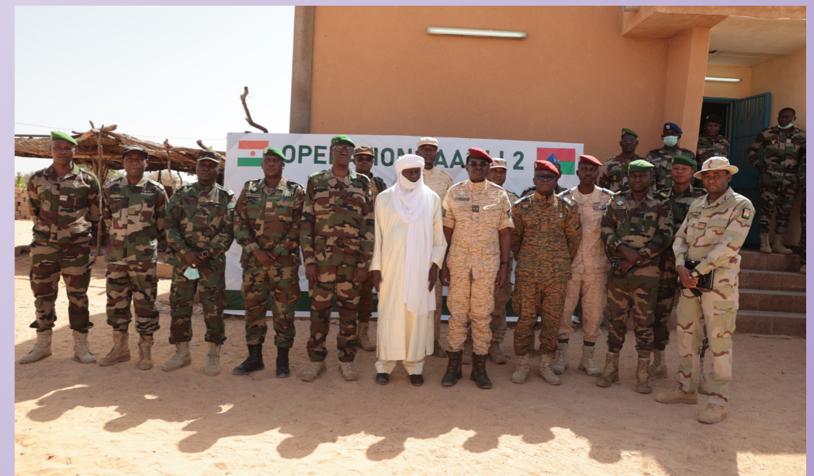
Photo de famille à l'issue de la visite