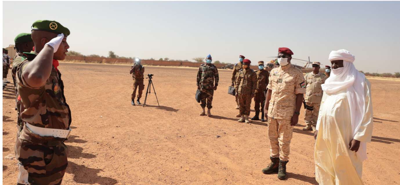
Les ministres en charge de la défense du Burkina et du Niger à leur arrivée à Tillabéri

Accompagnés par le chef d'état-major des Armées du Niger et le Chef d'état-major général adjoint des Armées du Burkina Faso, les deux ministres ont d'ores et déjà annoncé une opération TAANLI 3 pour consolider les résultats obtenus.