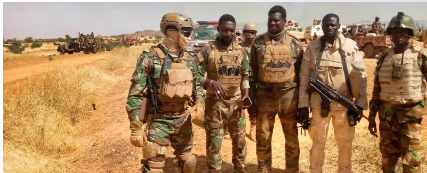
Unités Burkinabè et nigériennes ont manoeuvré ensemble sur le terrain