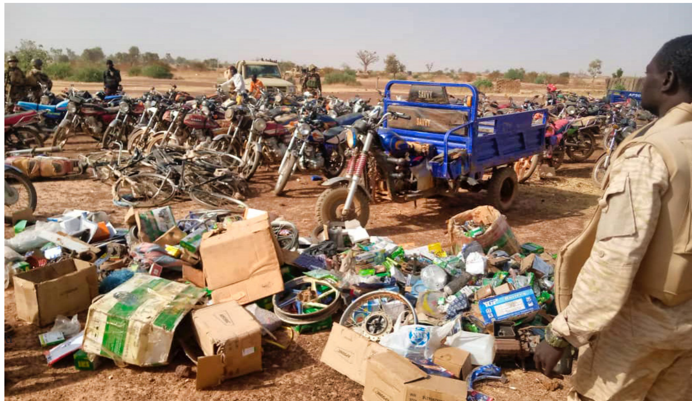
Une vue du matériel saisi