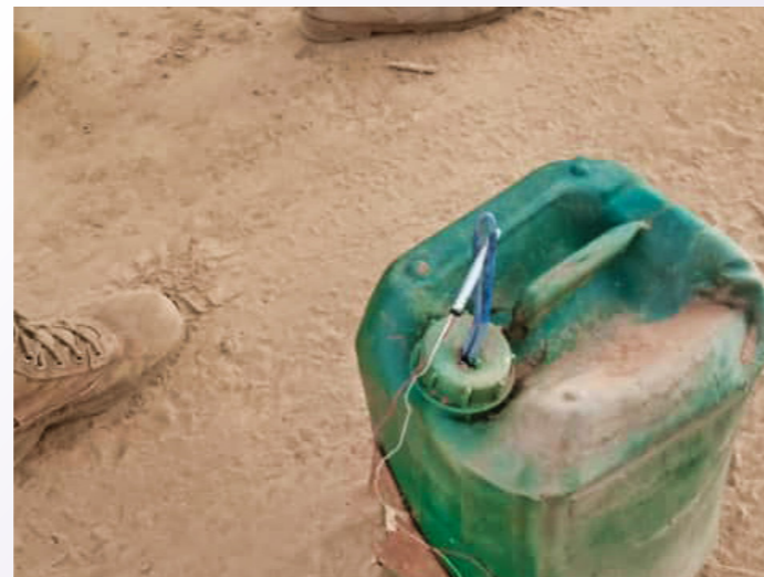
Un engin explosif découvert lors d'une mission