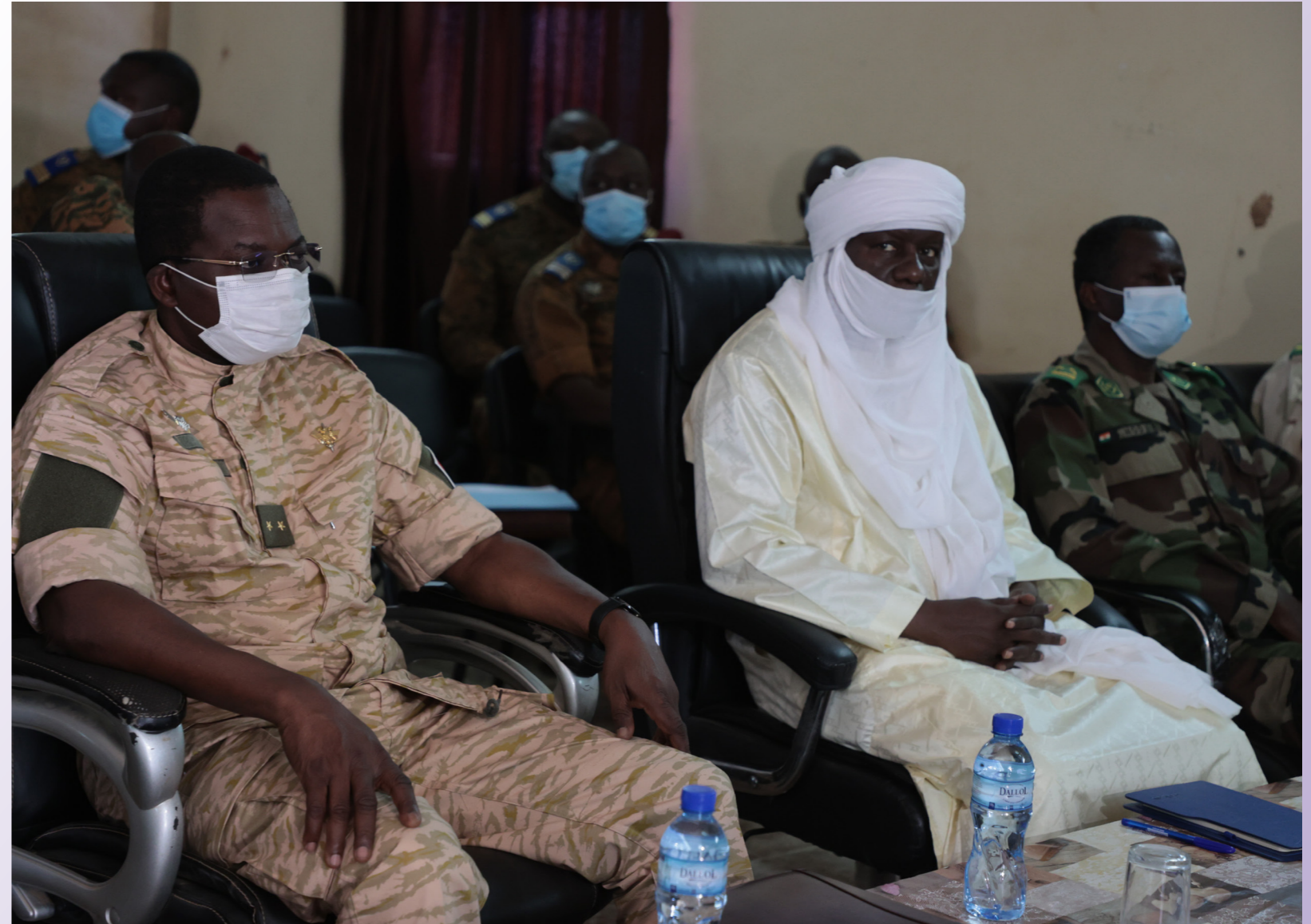
Les ministres en charge de la défense du Burkina et du Niger lors du briefing au PC conjoint