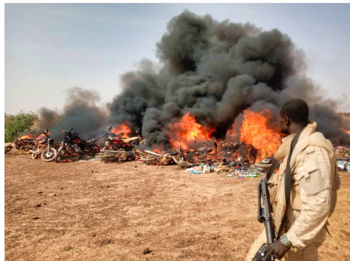
Une partie du matériel saisi a été détruit