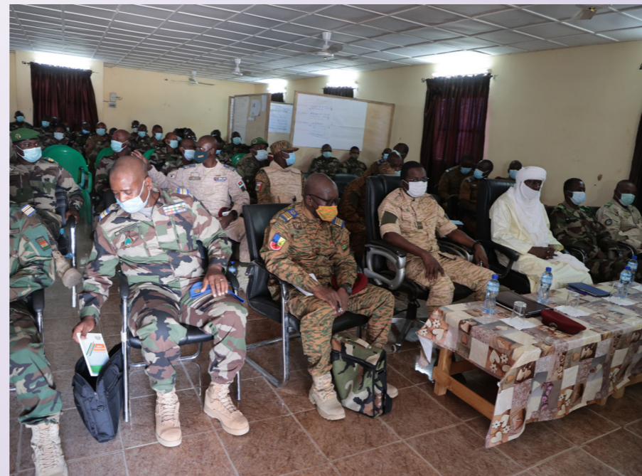
Les autorités en salle de Briefing